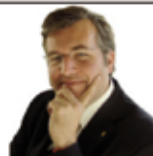
SENATOR MAG. THILO BÖRNER